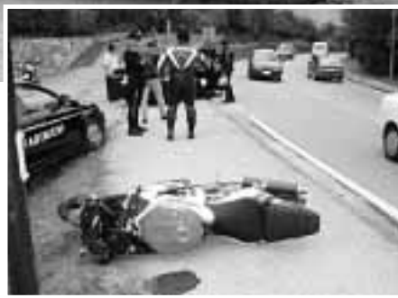
Il luogo del grave incidente ed i primi soccorsi

dove è stato subito sottoposto ad una serie di accertamenti. In particolare destava preoccupazioni il trauma toracico subito nel tremendo urto contro il lampione.