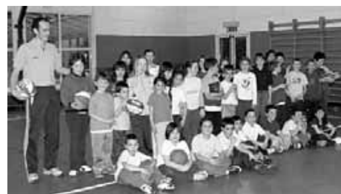
Il centro basket dell'Apecheronza a Serravalle all'Adige

Chiunque fosse interessato a praticare la pallacanestro può partecipare, anche in prova, ai primi incontri o ricevere informazioni ai numeri 333/6300272